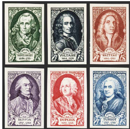
France - Poste - 853/58