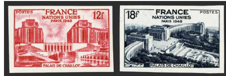
France - Poste - 818/819